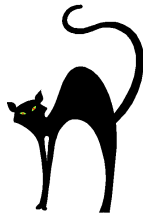
un/le chat noir