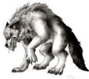
un/le loup garou