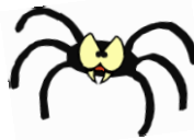
une/ l' araignée