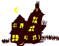
une/la maison hantée