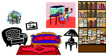
le salon / le living