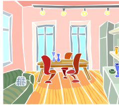
la salle à manger