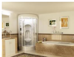
la salle de bains