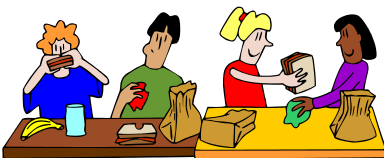
manger à la cantine avec les copains