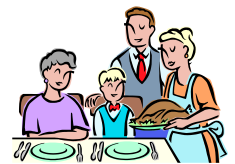
manger à la maison avec toute la famille.