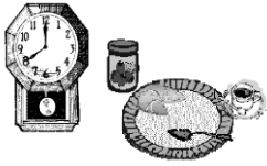
le petit déjeuner